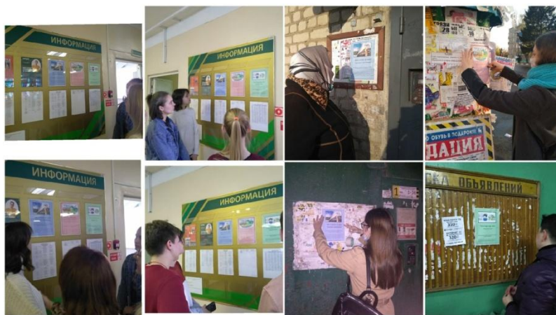
Рисунок 2 Экологические брошюры

Мы сделали собственные брошюры с различными картинками, лозунгами и пояснения к ним. Повесили их в Липецком металлургическом колледже, на стендах остановок и подъездов в городах Грязи и Липецк. Прохожих очень заинтересовали наши брошюры, многие останавливались и читали их. Выше сказанное подтверждает рисунок 2. Мы надеемся, что они поменяют своё отношение к экологии в лучшую сторону.