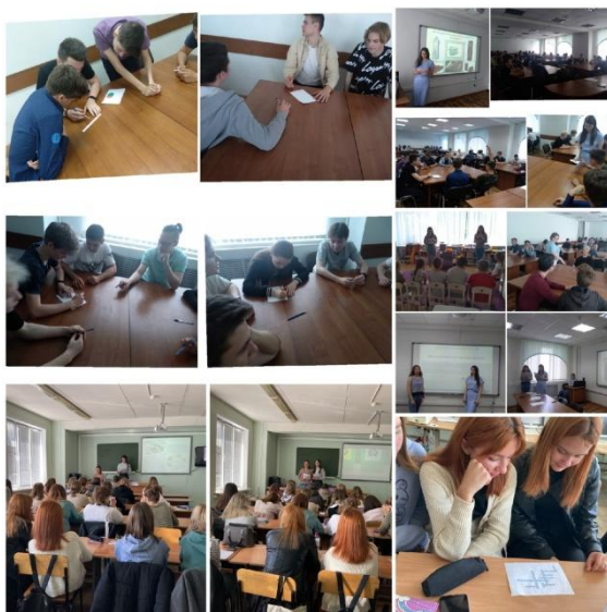
Рисунок 4 Экологическое мероприятие в «Липецком металлургическом колледже»

За последний год мы провели более 5 мероприятий, связанных с экологическим просвещением и образованием. Сейчас мы понимаем, что всё это делаем не напрасно, ведь студенты нашего колледжа чаще интересуются и участвуют в экологических мероприятиях. Мы рады, что послужили для них примером.