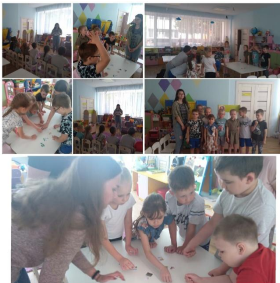
Рисунок 3 Экологическое мероприятие в детском саду

Также мы посетили МАДОУ детский сад № 126 города Липецк, где провели экологическое мероприятие. Первым делом рассказали детям про науку «Экология», как она связана с окружающей природой, животными и людьми. После мы перешли к играм, разделившись на команды, дети начали активно участвовать. Сказанное выше представлено на рисунке 3.