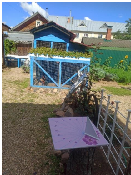
Приложение 3. Обустройство вольеров для кур на станции юных натуралистов